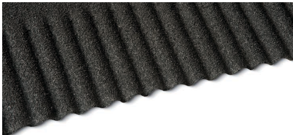
Detail Ubiflex Ribbel

Ubbink BV Postbus 26 6980 AA Doesburg T (0313) 480 380 F (0313) 473 942 verkoop@ubbink.nl www.ubbink.nl